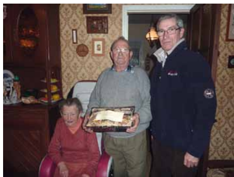
Distribution des colis de Noël