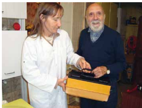
Portage des repas à domicile

Une autre opération témoigne de cette volonté pour des actions de prévention. Si vous habitez à proximité d'une personne âgée ou isolée, vous pouvez vous inscrire à la mairie comme "voisin solidaire". Par exemple, des volets fermés trop longtemps sont parfois l'indice d'un incident grave : en le signalant, une vie peut être sauvée comme cela s'est déjà produit à trois reprises. Avec le CCAS, l'équipe municipale et les bénévoles, c'est tout un réseau de gens solidaires les uns des autres qui participent à la justice sociale, essentielle à la cohésion de la commune.